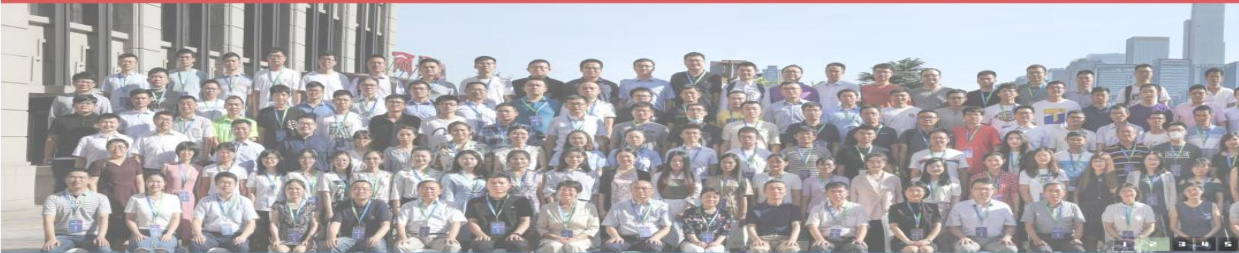
2020年8月3日至5日，中国核工业勘察设计协会在重庆市组织召开了2020年度核工业行业工程建设质量管理小组活动成果交流会。生态环境部核与辐射安全中心...